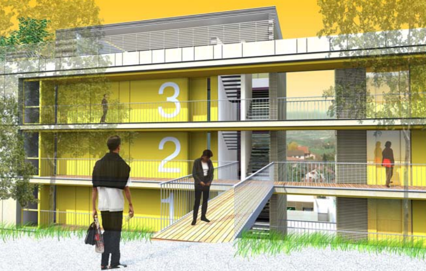
Perspective sur la percée visuelle depuis l'accès à la passerelle