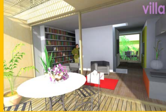
Couper - Perspective sur une maison individuelle type T2