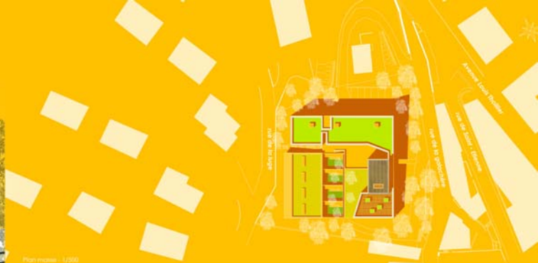
Plan masse - 1/2000