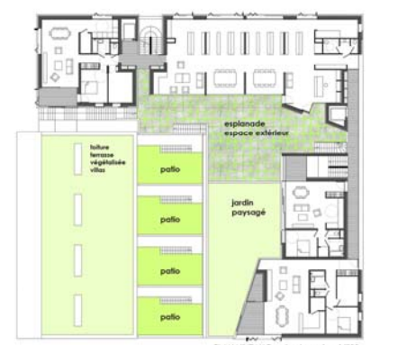
PLAN NIVEAU Rez de chaussée - 1/200