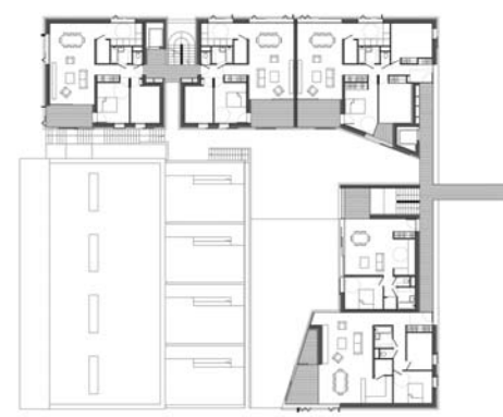
PLAN NIVEAU des étages R+1 / R+2 / R+3 - 1/200