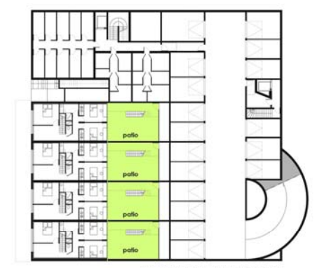
PLAN NIVEAU R/2 (niveau bas des villas) - 1/200