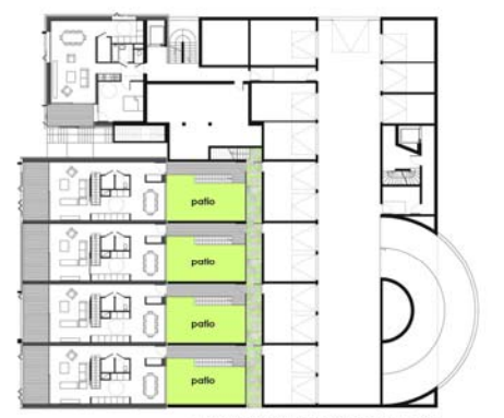
PLAN NIVEAU R-1 (rez de chaussée des villas) - 1/200