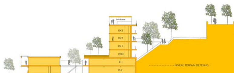
Coupe de principe d'implantation sur le terrain