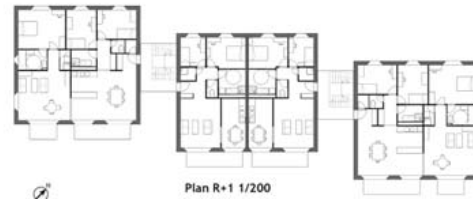
Plan R+1 1/200