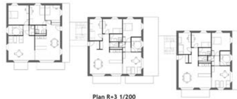
Plan R+3 1/200