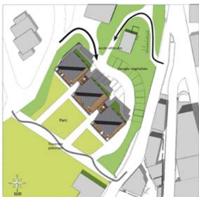
Plan masse 1/200