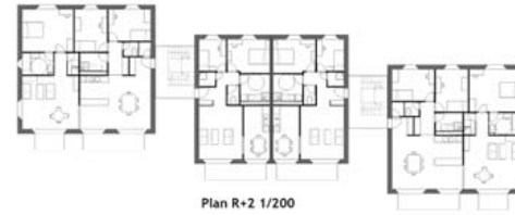
Plan R+2 1/200