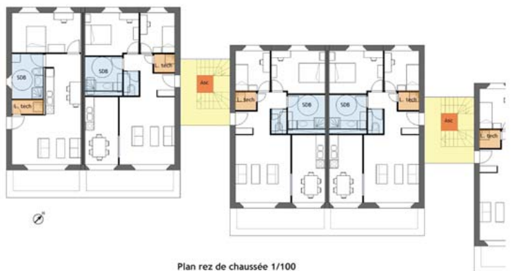
Plan rez de chaussée 1/100